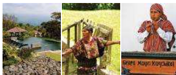
Golful La Reunion